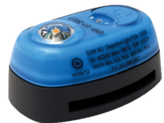
Dan W3, Daniamants mest solgte sikkerhedslys til redningsveste

Markedet for Daniamants produkter er præget af en stor prismæssig konkurrence som følge af øget konkurrence fra flere nye producenter i Kina og i Europa. Daniamant vurderer, at selskabet trods et mindre volumenfald har opretholdt sin markedsandel inden for redningslys, men har været nødsaget til at matche en aggressiv prissætning fra konkurrenter.