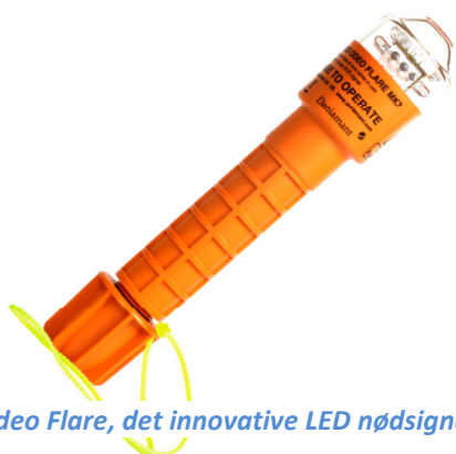
Odeo Flare, det innovative LED nødsignal

Daniamant har i 2014 erhvervet Odeo Flare, som er et "electronic Visual Distress Signal (eVDS), der kan erstatte eller supplere pyrotekniske håndblus. Odeo