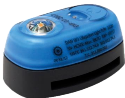
Dan W3, Daniamants mest solgte sikkerhedslys til redningsveste

Alle tre produktområder, Safe People , Safe Systems , og Safe Sailing har bidraget til den forøgede omsætning.