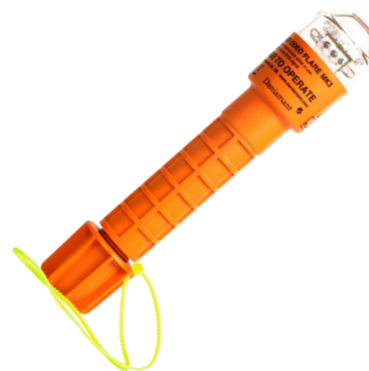
Odeo Flare, det innovative LED nødsignal

Den løbende produktudvikling inkluderer aktuelt en ny version af det innovative LED nødsignal Odeo Flare. Den nuværende version af Odeo Flare blev i 2016 kåret som "Best Buy" af det britiske magasin Practical Boat Owner.