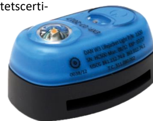
Dan W3, Daniamants mest solgte sikkerhedslys til redningsveste

Markedet for sikkerhedslys til lokalisering af overlevende kan karakteriseres som en nicheforretning inden for redningsudstudsindustrien. Et vigtigt aspekt af markedet er de forskellige kvalitetscertificeringer og internationale standarder, som er lovkrav. Leverandørerne og kunderne skal være i besiddelse af alle nødvendige godkendelser for både virksomheden og dets produkter, herunder ISO 9000, MED, SOLAS, ATEX, IECEX samt yderligere en række internationale godkendelser. Alle ovennævnte certificeringer skal fornyes løbende.