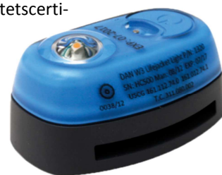
Dan W3, Daniamants mest solgte sikkerhedslys til redningsveste

Markedet for redningslys til lokalisering af overlevende kan karakteriseres som en nicheforretning inden for redningsudstyrsindustrien. Et vigtigt aspekt af markedet er de forskellige kvalitetscertificeringer og internationale standarder, som er lovkrav. Leverandørerne og kunderne skal være i besiddelse af alle nødvendige godkendelser for både virksomheden og dets produkter, herunder ISO 9000,