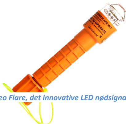
Odeo Flare, det innovative LED nødsignal

Årets omsætning blev på DKK 89,5 mio., hvilket er uændret i forhold til 2014, men højere end forventet ved årets start bl.a. som følge af den stigende GBP valutakurs. Indtjeningen for 2015 er lavere end forventet ved årets start, hvilket primært kan henføres til omkostninger på i alt godt DKK 7 mio. forbundet med direktørskiftet, ekstraordinære nedskrivninger på udviklingsprojekter og varelagre samt hensættelse til reklamationer.